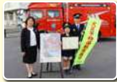
最優秀賞の表彰式を行いました。